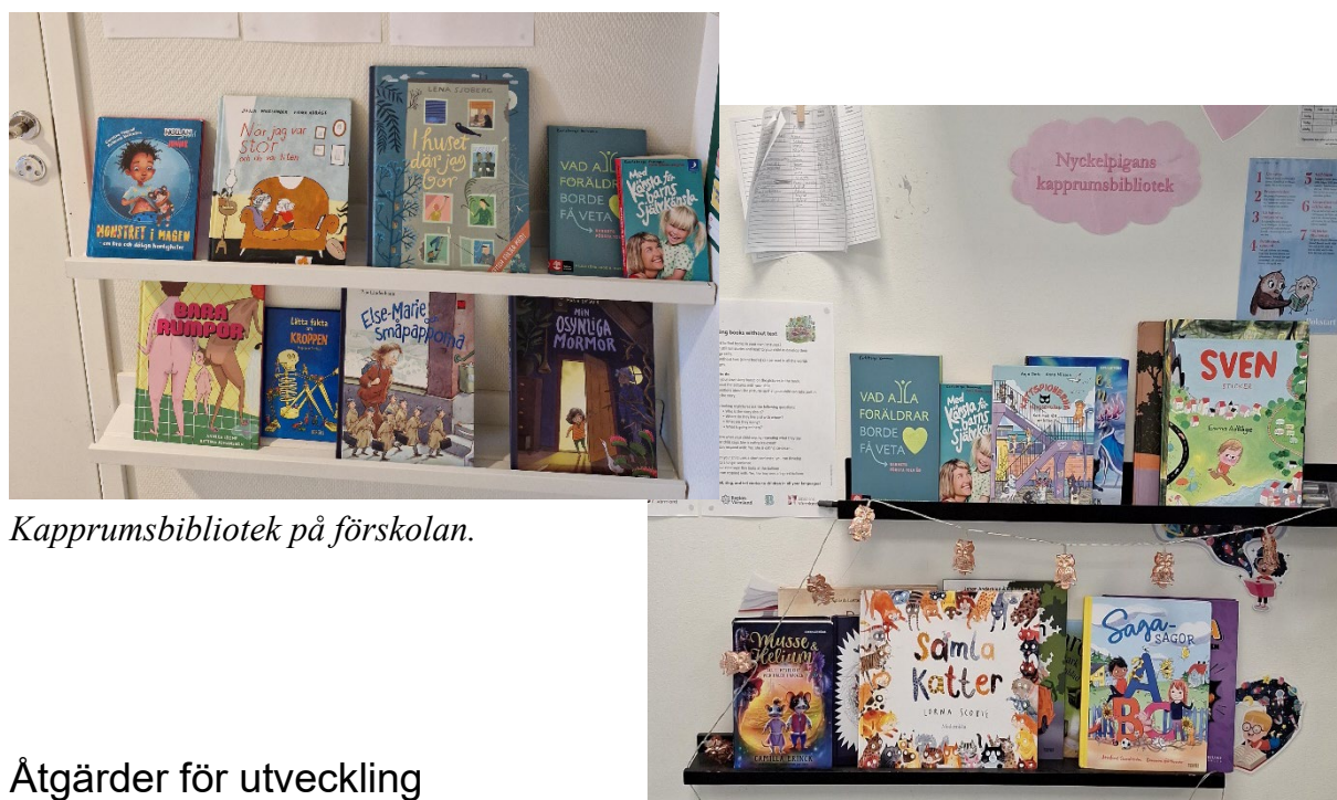
Kapprumsbibliotek på förskolan.

Kapprumsbiblioteken möjliggör smidig utlåning av böcker som barnen varit delaktiga i att köpa in utifrån deras intressen. Kapprumsbiblioteken på förskolan gynnar barnens möjligheter till högläsning i hemmet vilket i sin tur stärker deras språkutveckling.