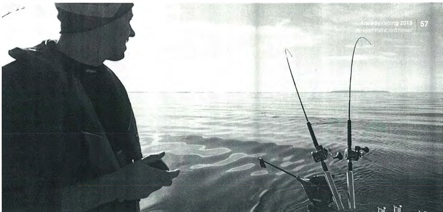
Fiske på Vättern.