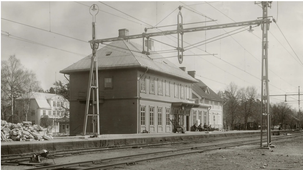
Karlsborgs stationshus efter ombyggnaden

Byggnaden är upptagen i skriften Kulturbistorisk inventering av Karlsborgs kommun, 1986 (Skaraborgs länsmuseum). Då stationsbyggnaden bedöms ha ett stort kulturhistoriskt värde förses byggnaden med varsamhetsbestämmelse samt skyddsbestämmelser mot rivning och extern förvanskning (q 1 ) med stöd i PBL 8 kap. 13§ (förbud mot förvanskning) samt 17§ (varsamhetskrav).