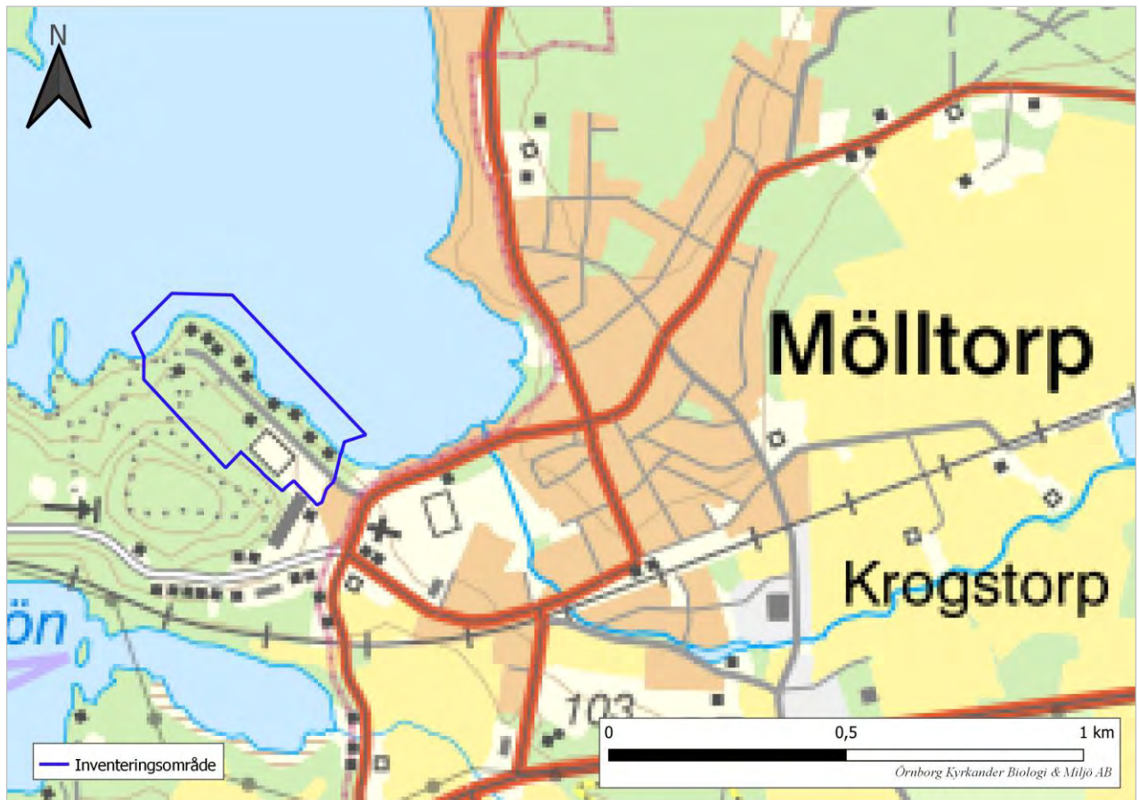
Figur 1. Lokalisering av det aktuella planområdet.

Karlsborgs kommun har gett Örnborg Kyrkander Biologi & Miljö AB i uppdrag att göra en naturvärdesinventering som en del av detaljplanearbetet. Det aktuella planområdets lokalisering framgår av figur 1.