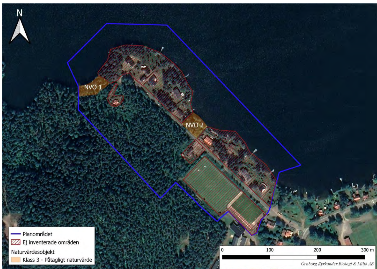
Figur 4. Identifierade naturvärdesobjekt.

Naturvärdesinventeringen resulterade i två identifierade naturvärdesobjekt med förhöjda naturvärden. Båda dessa hade naturvärden motsvarande klass 3 (påtagligt naturvärde). Naturvärdesobjekten presenteras i figur 4 samt beskrivs nedan tillsammans med motiveringar till klassningarna.