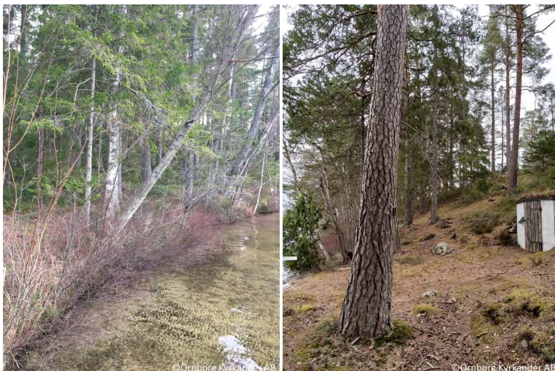
Figur 5. T.v. strandkanten med pors och lövträd som hänger ut något över vattnet. T.h. backen upp från stranden med de något äldre tallarna, och jordkällaren.

I stigens kant, i den lilla skärningen från stigen där vegetationen nöts ner växer vitmosslav på ett ställe. Ett drillsnäppepar flög fram och tillbaka längs strandkanten.