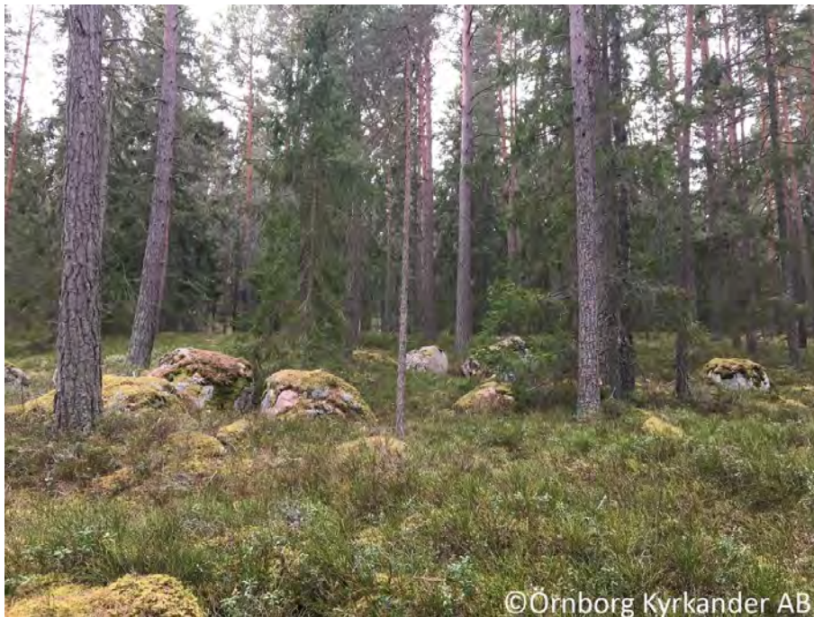
Figur 2. Produktionsskogen som utgör större delen av inventeringsområdet.

Fåglar som noterades i de delar av området som inte avgränsats som naturvärdesobjekt var bofink (sång), lövsångare (sång), svartvit flugsnappare (sång), grönfink, trädpiplärka (sång), talgoxe (sång), koltrast (sång), kungsfågel (sång) samt kråka. Av de arter som sjöng och som därigenom visar att de kan tänkas använda området för häckning är svartvit flugsnappare rödlistad som nära hotad (NT).