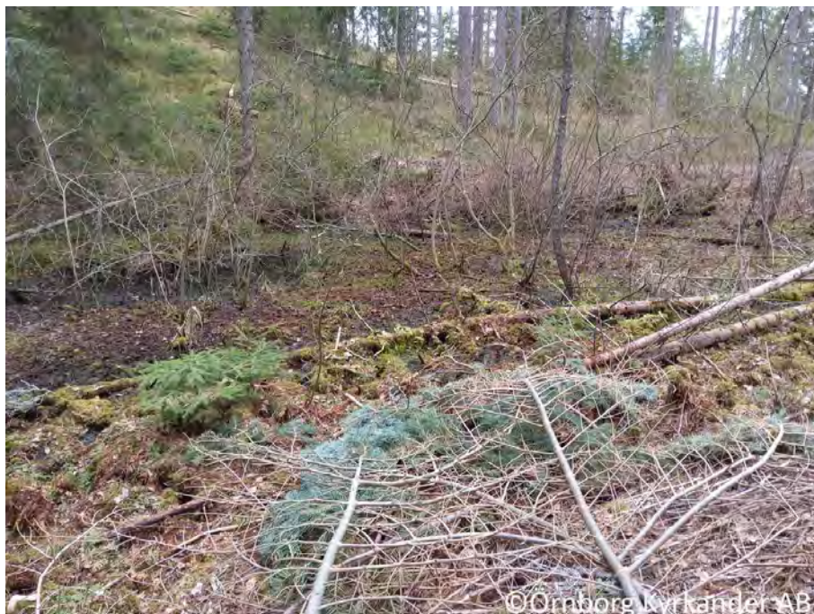
Figur 8. Värdeelement nr 1.