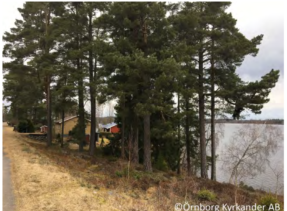
Figur 6. Tallslänten som utgör NVO 2.

Bland tallarna satt en rödstjärt, en lövsångare och en grönfink och sjöng.