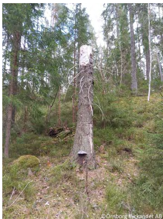
Figur 9. Överst värdeelement nr 2. Nederst värdeelement nr 3.