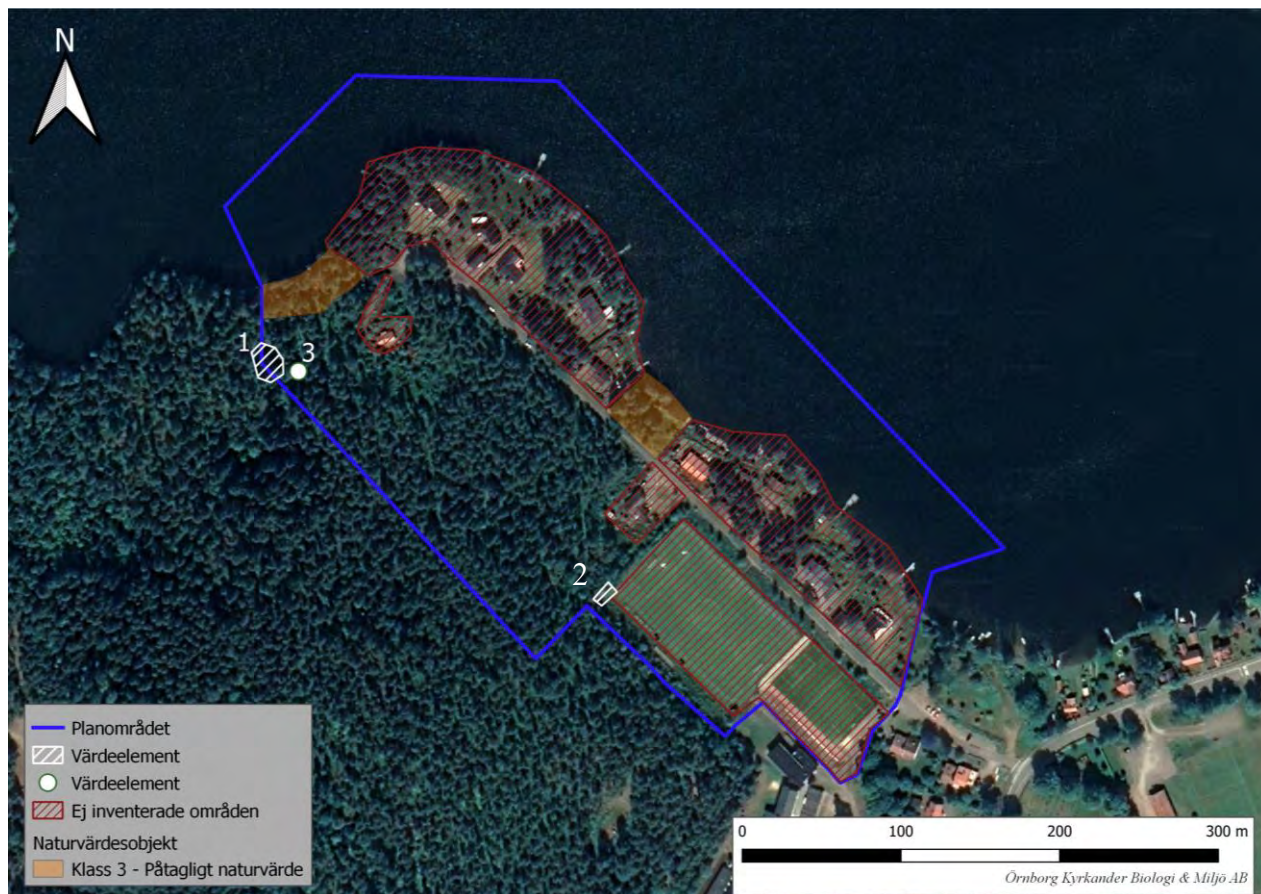
Figur 7. Identifierade värdeelement.